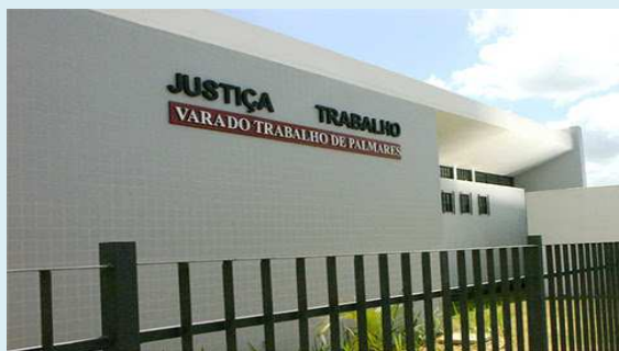
Vara do Trabalho de Palmares