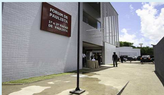
Vara do Trabalho de Pesqueira