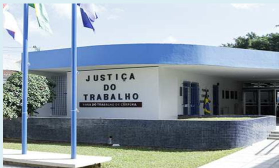
Vara do Trabalho de Carpiná