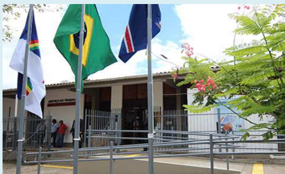
Vara do Trabalho de Escada