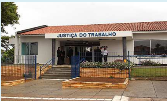
Vara do Trabalho de Garanhuns