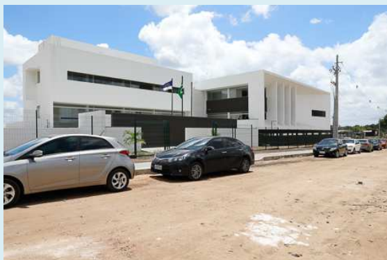
Varas do Trabalho de Goiana