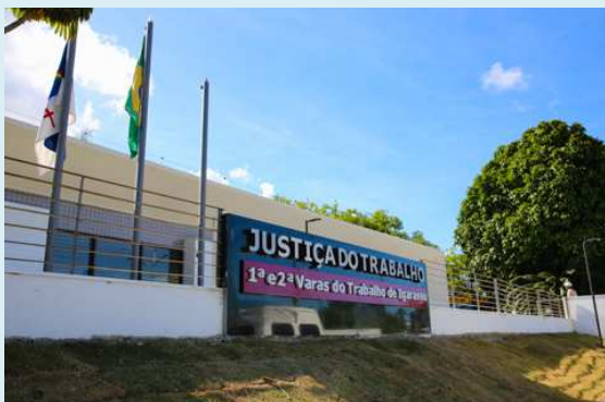
Fórum do Trabalho de Igarassu