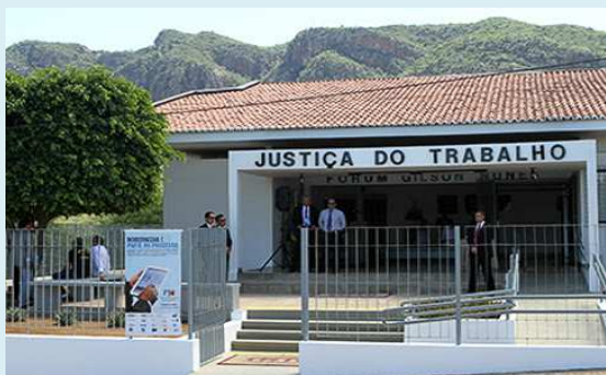
Vara do Trabalho de Serra Talhada