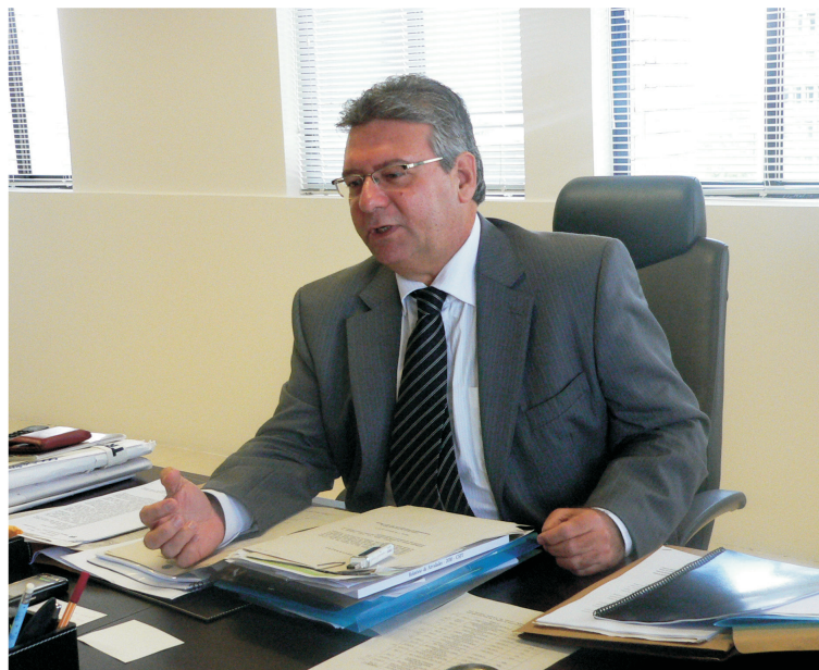
Desembargador André Genn destaca as vantagens do processo eletrônico

Graças à Lei 11.280, de 16 de fevereiro de 2006, que introduziu uma alteração no parágrafo único do art. 154 do Código de Processo Civil, os tribunais passaram a regulamentar os atos processuais por meio eletrônico. Além de possibilitar o envio de petições ou