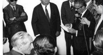
As mudanças nas relações socioeconômicas e as transformações na Justiça do Trabalho caminharam lado a lado nesses 70 anos